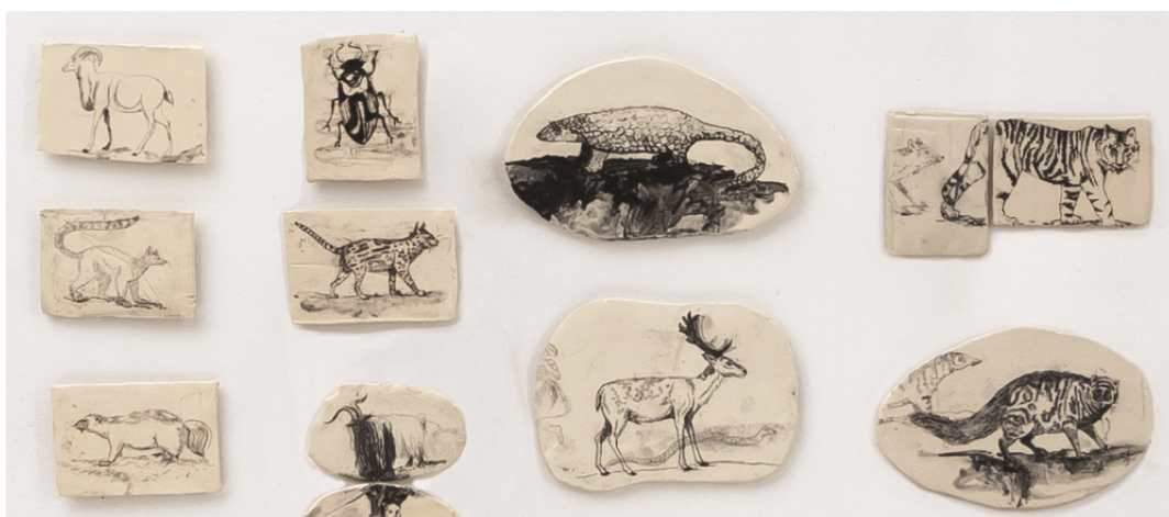
Série ' Ceramic Whisper ', dessin à l'oxyde sur faïence, 2020

C'est bien aussi de fragilité et de mémoire dont il pourrait s'agir à travers les Ceramics Whisper . Avec cette infinité de fragments de céramique portant un dessin d'animal, l'artiste dresse un bestiaire magnifique d'espèces inattendues. Un inventaire dans la lignée des ouvrages naturalistes mais tout à fait fantasque cependant. Une série comme une Arche de Noé. Chaque fragment est unique et porte un dessin réalisé au pinceau sur une plaque d'argile crue qui sera émaillée lors de la cuisson.