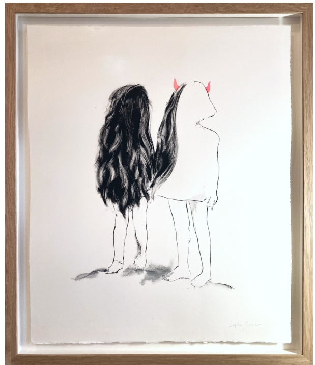
Twins and double, monotype et acrylique sur Velin d'Arches, 60 x 50 cm, 2019