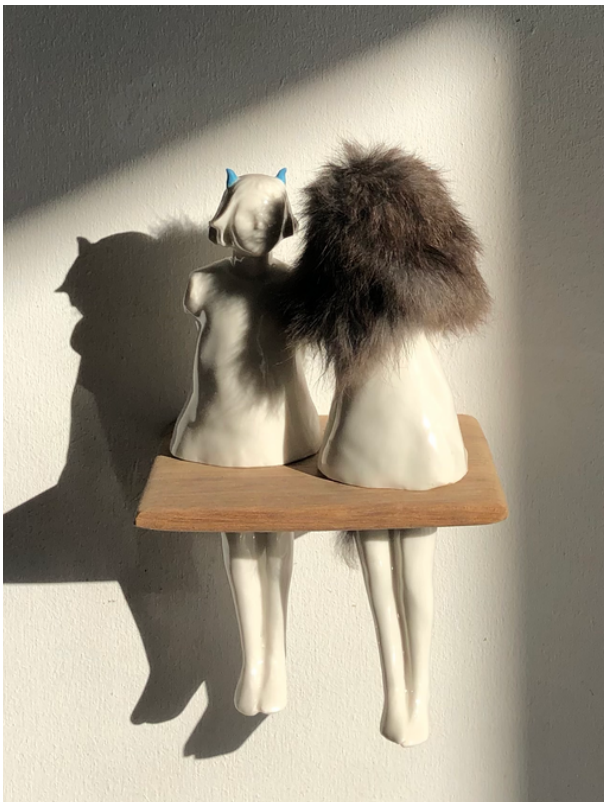
Série 'Find the lady', porcelaine, bois et fourrure, 23 x 14 x 12 cm, 2018