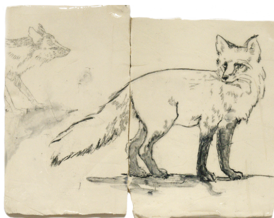
Ceramic Whisper n°38, dessin à l'oxyde sur faïence, 14,5 x 19 cm, 2020

A travers ses sculptures, ses dessins sur céramique ou sur papier, Delphine Grenier ne cesse de s'interroger sur notre place aujourd'hui dans le monde et met en scène entre grâce et gravité cette recherche absolue de l'autre et de soi-même.