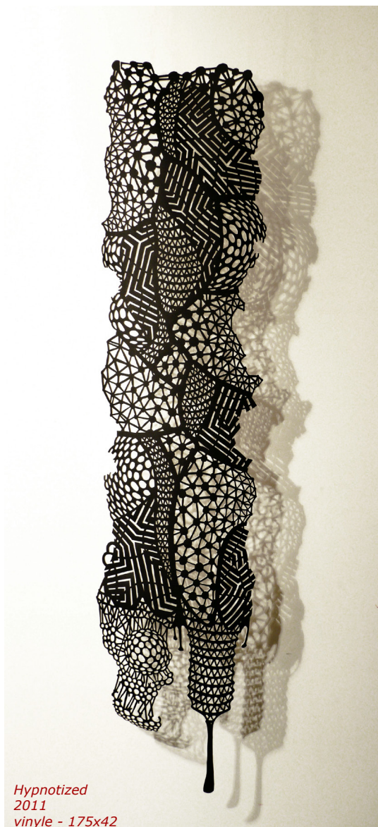
Hypnotized 2011 vinyle - 175x42