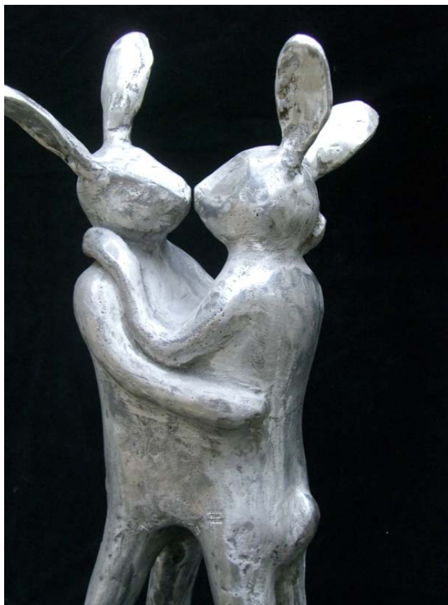
Pas de deux -2008 - fonte d'aluminium - 40 x 16 x 13 cm