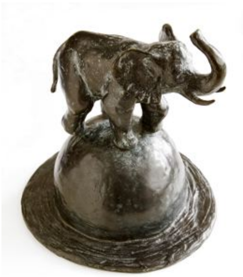
Eléphant-2006- bronze- 25 x 22 x 22 cm