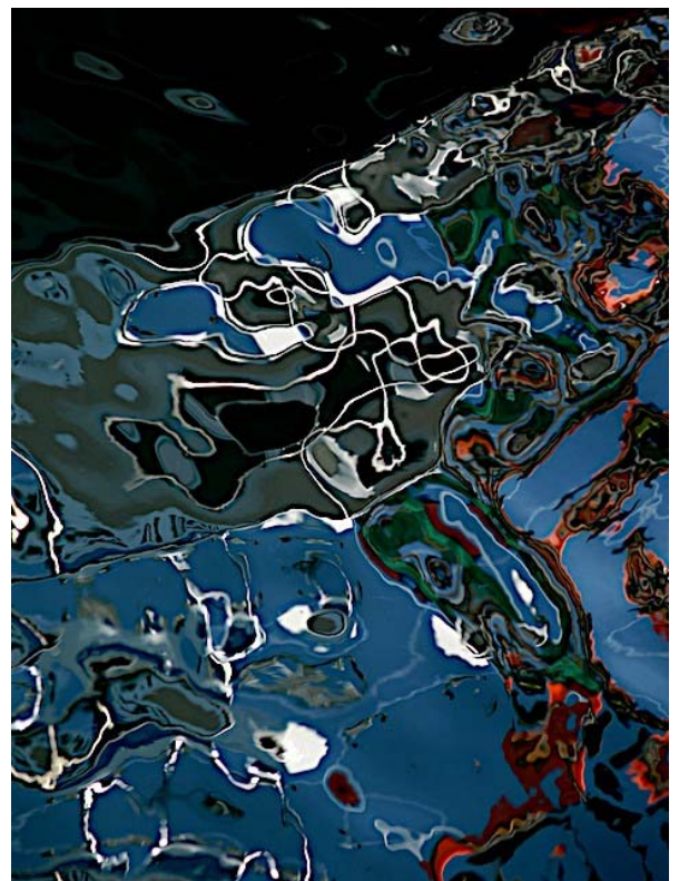
Réflexion 10 - 2008 - diasec - 120 x 90 cm