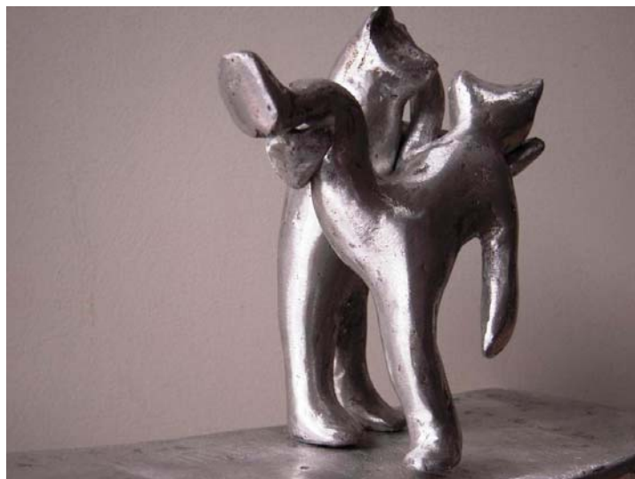
E pericoloso -2009- fonte d'aluminium- 32 x 35 x 15 cm