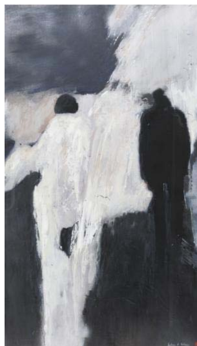
Nuit blanche 2008 150 X 100 cm Technique mixte sous altuglas