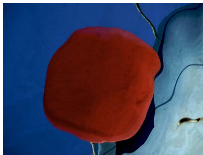
Réflexion 2 - 2008 - diasec - 90 x 120 cm

On peut aussi se laisser prendre par ... Quoi ? Il y avait tout cela dans l'eau du port, il suffisait de se pencher ! Oui, c'est vrai, il suffisait de ... saisir le meilleur instant, le reflet, l'image de reflet, cette tache rouge et molle, cette hachure verte qui structure l'espace, ces volutes de bleu parfois granulées, parfois lisses, cette perte de repère et d'échelle, et surtout cette lumière, brillante et belle.