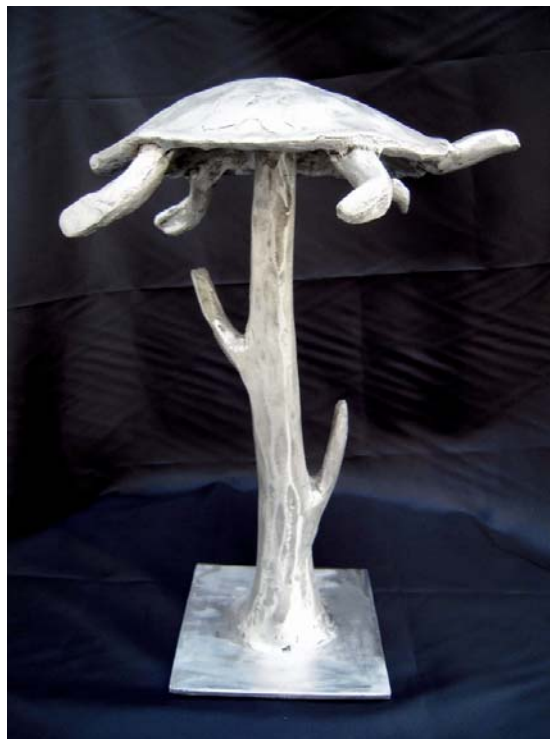
Arbre à tortue - 2009 – fonte d'aluminium - 37 cm

2002 – Musée de Kyoto, JAPON - Galerie Deon-Mayer, Paris 3 ème