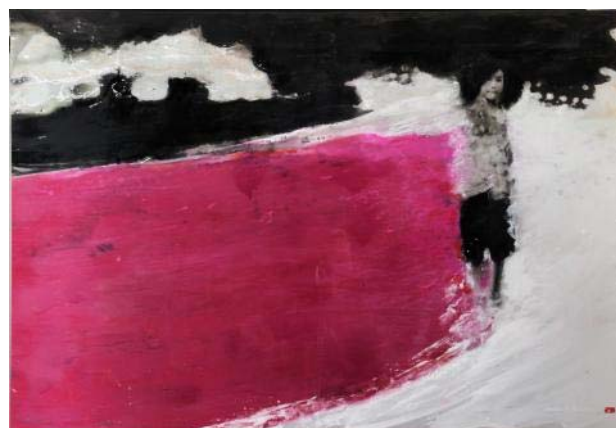
Résilience 2 2008 114 X 155 cm