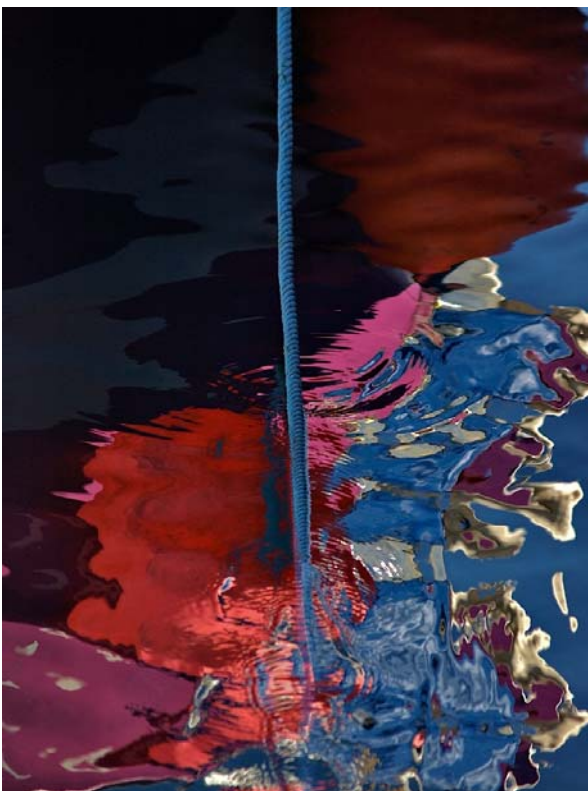
Réflexion 4 - 2008 - diasec - 120 x 90 cm

Eric Atlan est né en 1958. Après des études de photographie à Paris, il travaille plusieurs années dans le domaine de l'illustration, de la mode, de la photo en studio. Sa formation au CREAR, école de cinéma, lui ouvre ensuite le monde de la réalisation de fictions et de films documentaires. Il collabore ainsi à la création d'œuvres audiovisuelles pour de grandes chaînes nationales. Depuis quelques années, avec l'émergence de la technologie numérique, il revient à sa passion première, la photographie, qui n'a jamais cessé de l'accompagner.