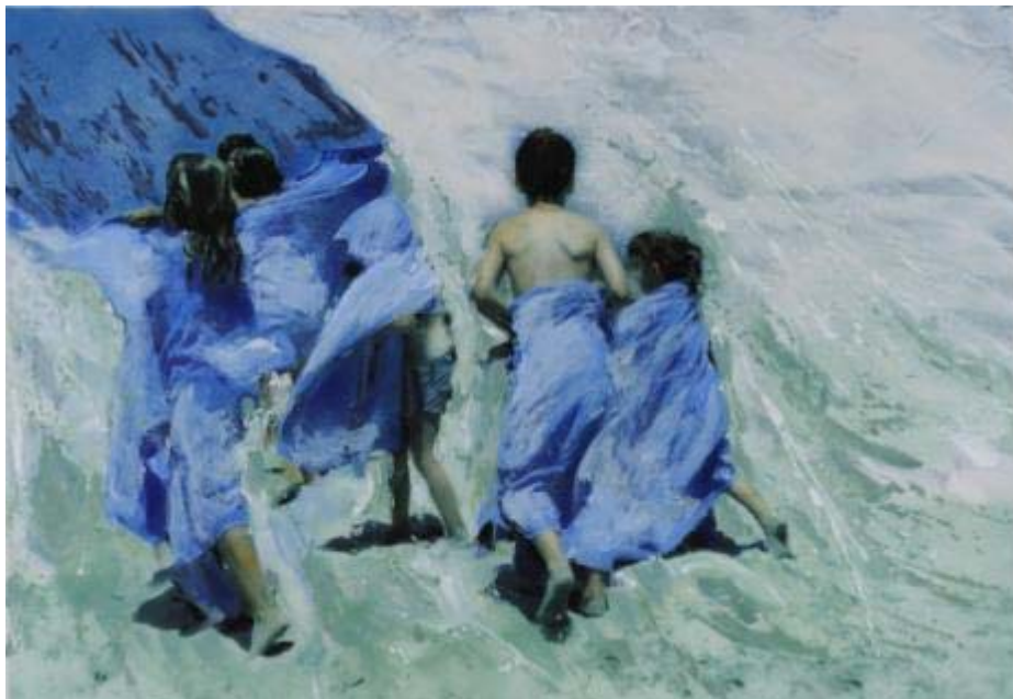
Présences 3 - 2009 - 104 X 140 cm Technique mixte sous altuglas

Tout commence par un choc, une percussion [...] La magie opère sans que l'on sache pourquoi : il y a du sens, entre l'air et l'eau, l'opacité et la transparence, toutes les tensions sont présentes.