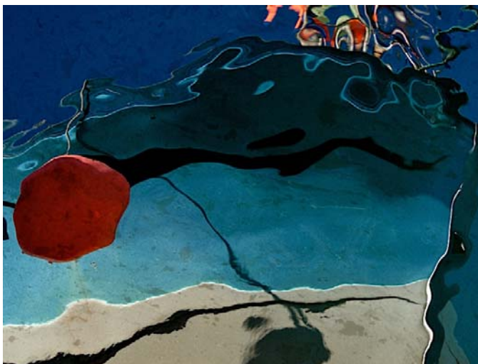
Réflexion 1 - 2008 – tirage argentique sous diasec - 60 x 80 cm

On peut se laisser prendre à vouloir retrouver là, dans ces traits noirs sinueux, l'immatriculation d'un bateau, une amarre... Mais ces images du port disparaissent dans des combinaisons esthétiques fluides ; des réminiscences de grands maîtres de la peinture moderne jaillissent de ces photos instantanées.