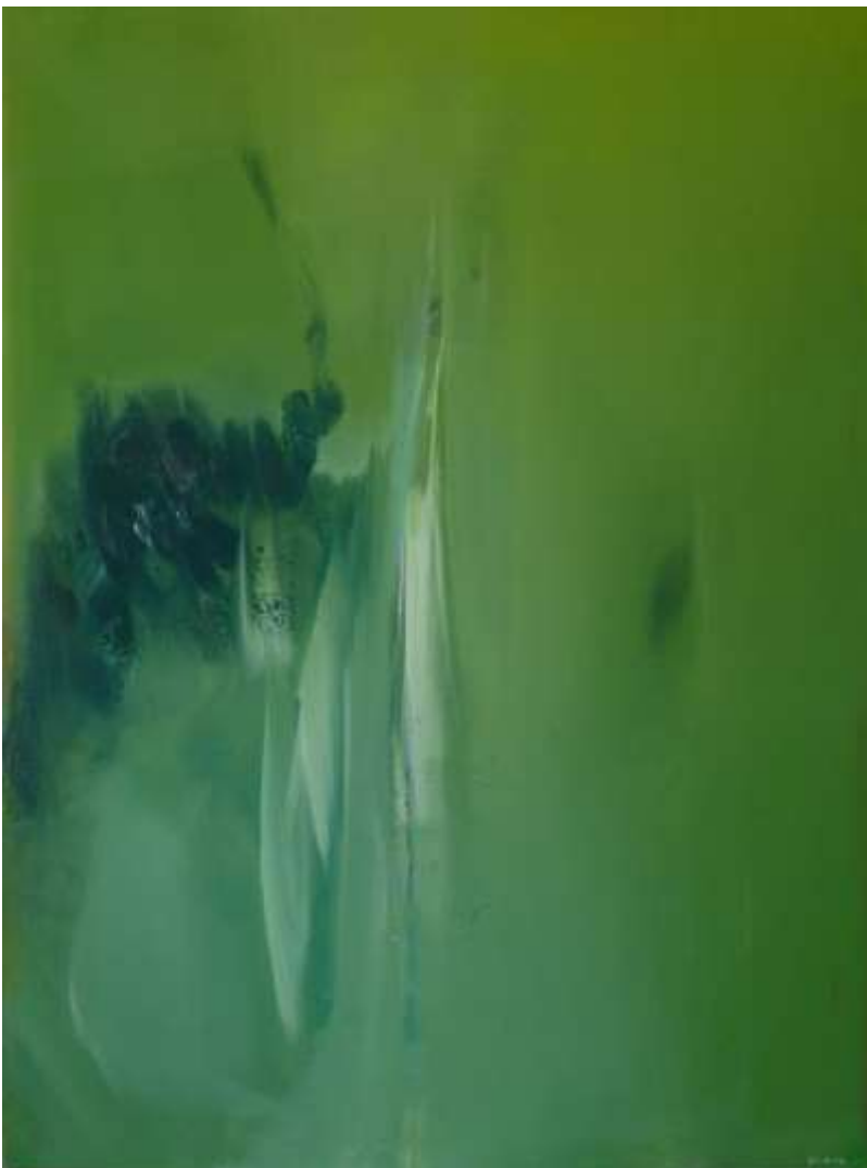
Hommage à Messian Huile sur toile

Bénédicte Plumey expose depuis 1981 en France et à l'étranger.