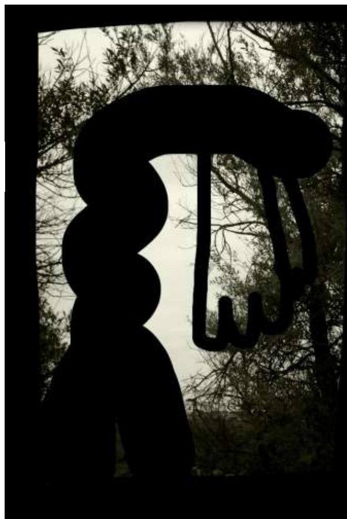
Sans titre Composition numérique

La découverte des effets de l'huile en transparence et les possibilités infinies de compositions en superpositions de plusieurs feuilles vont l'amener à produire la série exposée ici pour la 1ère fois à la Galerie Insula.