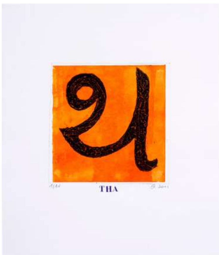
Lettres à l'être - Signe Gujrati Gravure carborundum

Du dessin marouflé à la céramique, en passant par la technique de la gravure au linoléum, elle devient tout naturellement l'illustratrice de nombreux ouvrages de bibliophilie consacrés à Eros et ses jardins des délices.