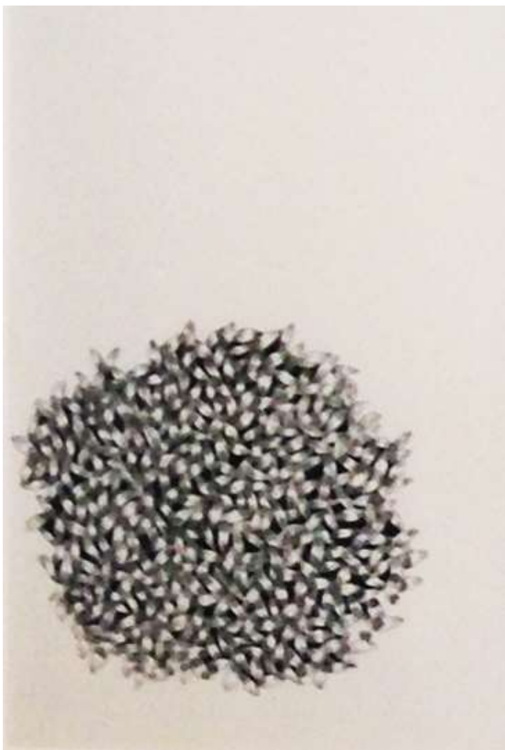
Crayon-feutre sur papier

Né en 1981, elle vit et travaille à Paris.