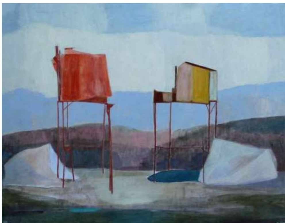
Perched House Gouache cirée sur papier marouflé sur toile

Au fil subtil, minimal mais sensible, de l'organisation de chaque dessin, chaque ligne invite à un voyage. Il s'agit de la suivre, de vivre en elle la réaction amoureuse et souple que génère la rencontre avec une autre ligne, toute aussi intrigante. Puis d'en croiser une autre. Et finalement, de vivre l'éblouissement que provoque le réseau graphique achevé, engendrant la représentation d'un corps ou d'un objet, impalpable mais vif. L'ensemble est ouaté, enrubanné. Les matières angéliques choisies - crayon de papier, couleur aquarellée ou papier ciré - vont à la rencontre de l'invisible en lui faisant une part belle. Ode à la douceur, hommage à la parure, il ne s'agit pas ici de combat mais de séduction.