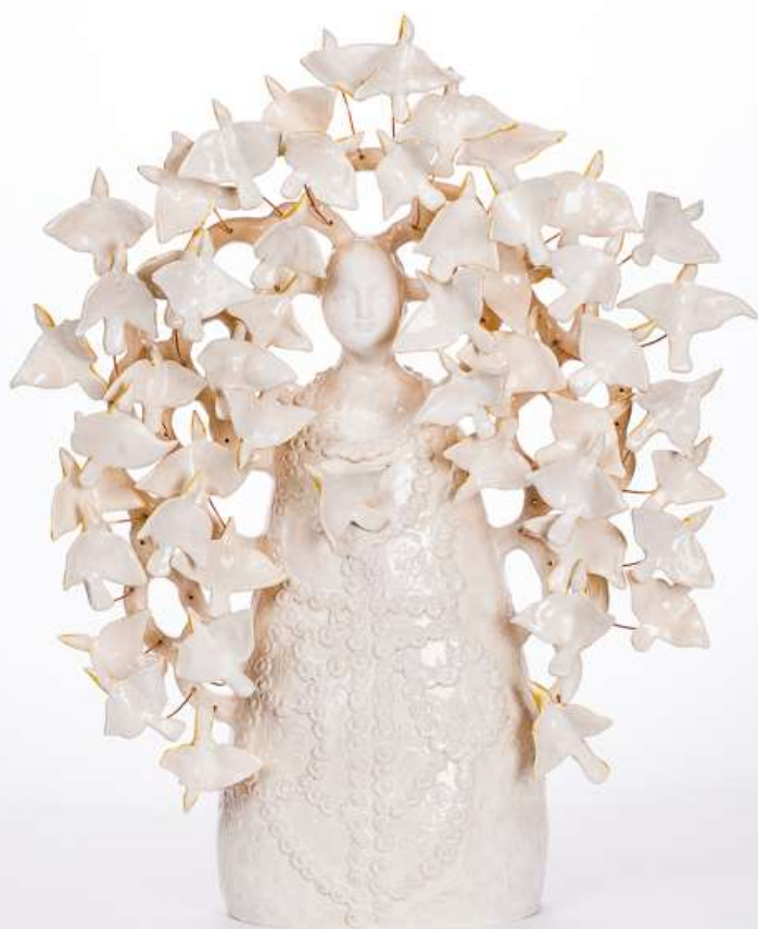
Arbre de vie aux oiseaux Faïence blanche émaillée