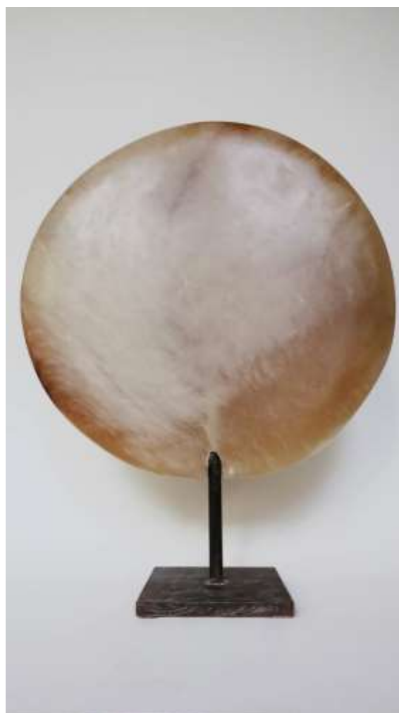
Lonely Moon Albâtre

Jérôme Festy vit et travaille à Vincennes.