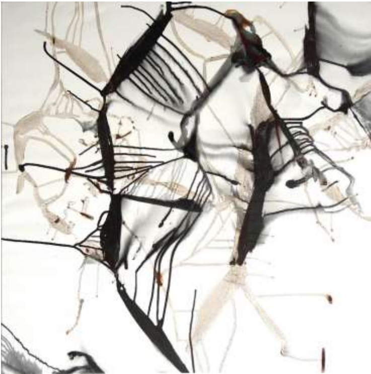
Rouille et encre sur toile Série « Remonter le fleuve »

“ Remonter le fleuve Ce que je dépose sur la toile, l'eau l'emportera, laissant résidus et sédiments inventer une nouvelle géologie propice au rêve. Le minéral, le vivant, où se trouve la limite, le point de passage de l'un à l'autre ? Ouverture vers une géographie fantasmée issue d'un labyrinthe de coulées de rouille et d'encre, comme une invitation au voyage, curieux de la magie du monde et de ses mystères.”