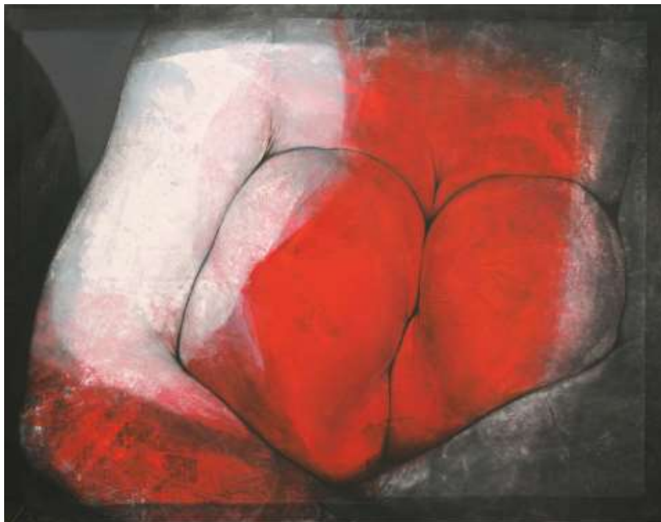
Genoux Rouges Acrylique et pigment sur papier marouflé sur toile

Il vit et travaille en région parisienne.