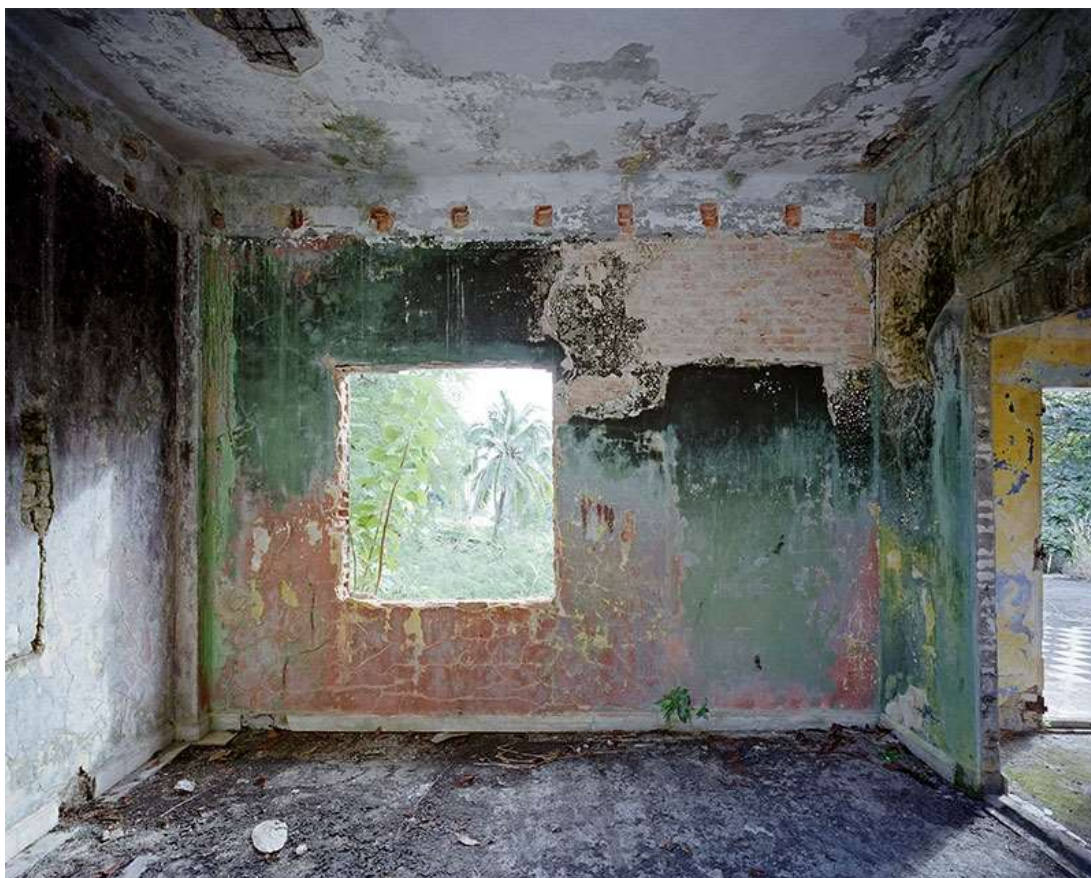
Renaissance Tirage Fineart Hahnemühle

Il débute dans la vie active comme juriste, mais organise son temps libre autour de ce qui devient peu à peu un projet artistique. Il commence alors à voyager hors de France à la recherche d'autres ruines et découvre le travail à la chambre.