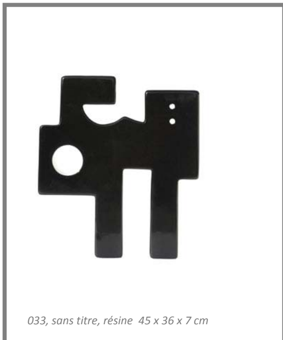
033, sans titre, résine 45 x 36 x 7 cm