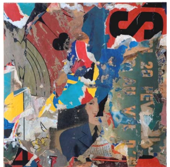
Archives - 2007 - collage - 35 X 37 cm

2006 - Grand Marché d'Art Contemporain, Bastille, Paris