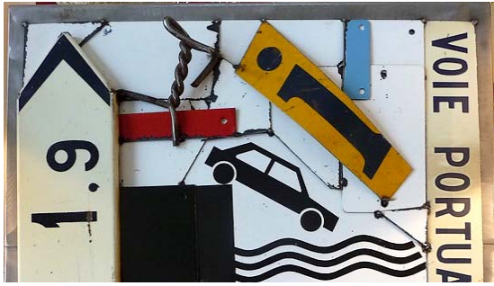
Détail panneaux émaillés sur tôle 2009 - 70 x 70cm