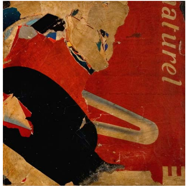
Diptyque noir et rouge - 2009 – collage sur toile - 100 x 200 cm