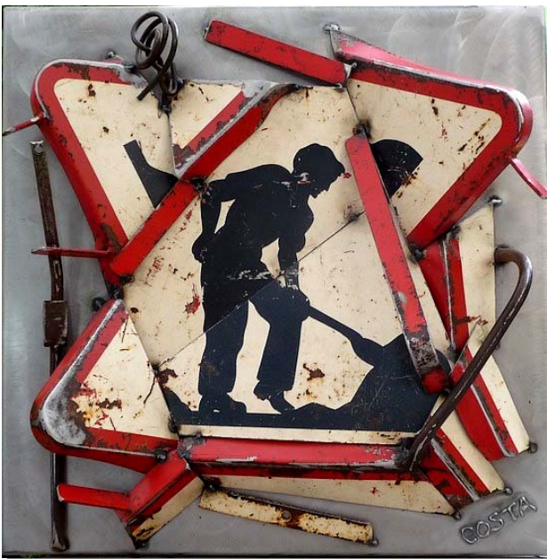
Panneau peint sur tôle 2009 60 x 60 cm