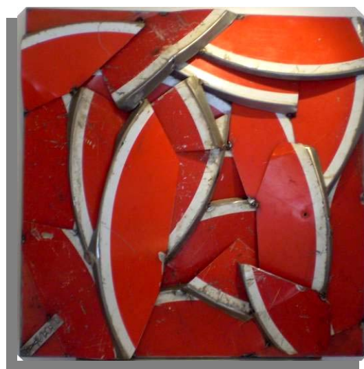
Panneaux adhésifs sur tôle 2009- 70 X 70cm

Alchimiste du conformisme , il soude de manière aléatoire des pièces en fer, aux formes informelles, dans un espace poli, aux angles droits. Celui qui affectionne les espaces cadrés, les points de soudures parfaits n'oublie pas qu'il a porté des uniformes toute sa vie... Le résultat est lumineux.