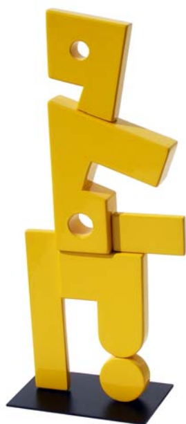
IL 02 bois laqué 2009 51 x 21 x 4 cm

grands modernes (Arp, Brancusi, Calder, Etienne-Martin, Moore, Smith, etc.), rappellent les Disney de Bertrand Lavier ou pourraient être rapprochées à la fois du minimalisme, du pop art et de la figuration libre. Libre et singulière est, en effet, son adaptation, sa manière de jeter un pont entre toutes ces références, entre abstraction et figuration, concept et expression.