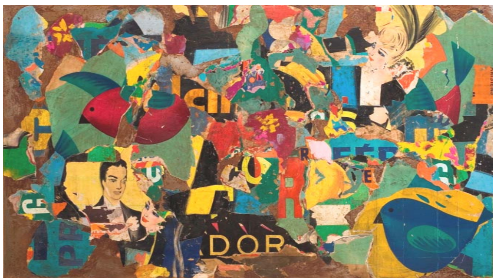
Les oiseaux du Mogador - 2008 – collage sur tôle – 102 x 81 cm