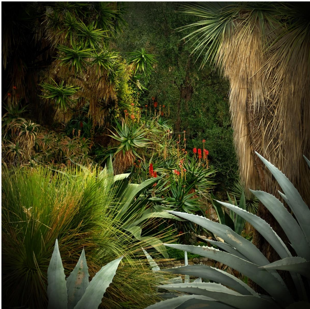
Jungles 3 , Tirage Fine Art, 100 x 100 cm, 2013, Ed. 5.

Exploratrice de territoires imaginaires, Olivia Lavergne se plaît à brouiller tous les repères géographiques pour transporter le regardeur dans un espace fictionnel totalement transfiguré par son objectif et par les subtils artifices qu'elle met en œuvre. Dans sa série Jungles , le spectateur est immergé dans une forêt tropicale dont la luxuriance fascine et dont l'étrange beauté invite irrésistiblement à l'exploration ou à la prudence.