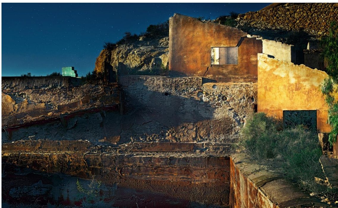
Anywhere out of the world 2 , Tirage Fine Art, 70 x 115 cm, 2015, Ed. 5.

Avec Anywhere out of the world - titre emprunté à Baudelaire - le paysage prend la forme d'un décor, et la scénographie de l'image rend possible de nouvelles associations visuelles et poétiques qui ouvrent un cheminement dans l'imaginaire des lieux.