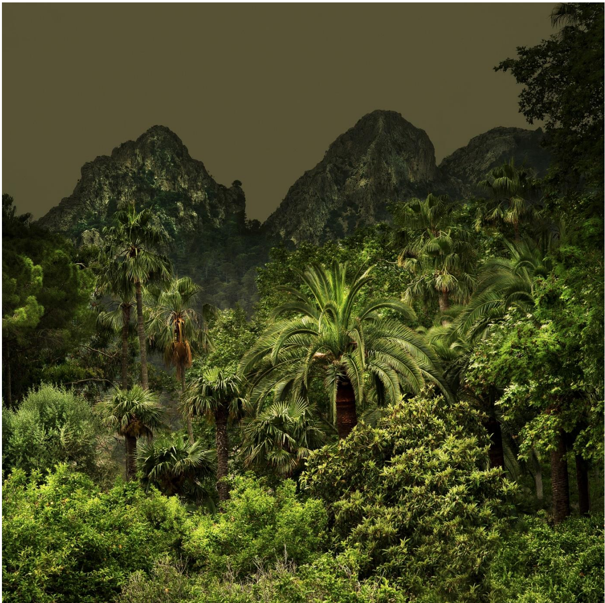
Jungles 2 , Tirage Fine Art, 100 x 100 cm, 2013, Ed. 5.