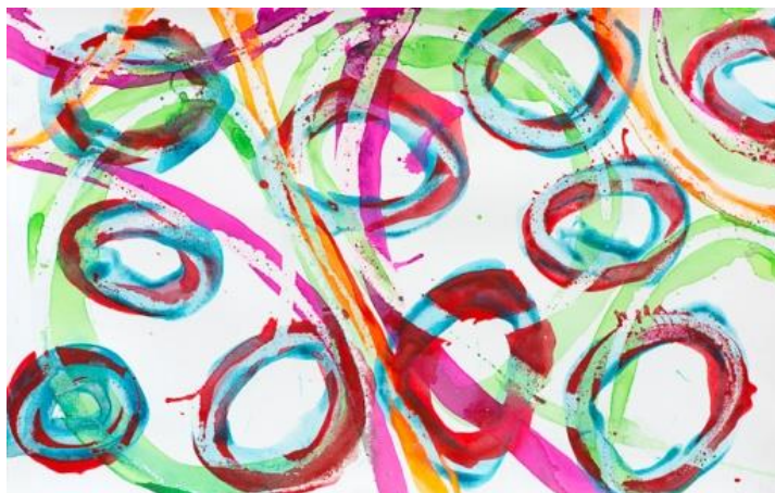
Sans titre II, technique mixte sur toile, 32 x 50 cm, 2018