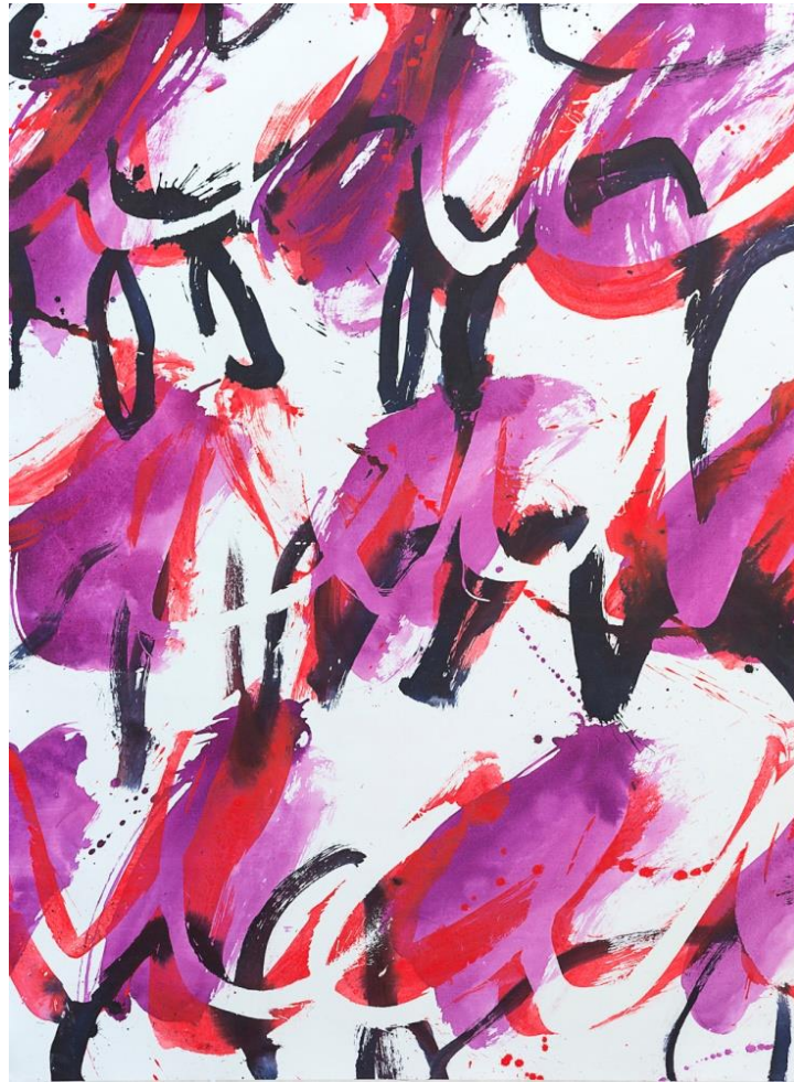
Refrain , technique mixte sur toile, 160x120 cm, 2018

Formats immenses emplis à la vitesse d'une envolée par de très larges brosses, chargées de couleurs épaisses sur des fonds éclatants. C'est l'image que l'on garde de la peinture d'Hélène Jacqz présentée notamment en 2016 à la galerie Insula et captée par le film de Romain Tardieu réalisé dans l'atelier de l'artiste*. Des œuvres nées d'un véritable corps à corps avec la toile, dans l'impulsion d'une chorégraphie déliée et puissante.