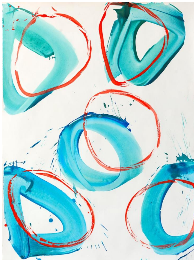
Pirouette II , technique mixte sur toile, 130 x 97 cm, 2018

La chorégraphie impulsive a fait place à une danse des signes plus contenue, un jeu avec le motif et sa répétition, où comme dans une partition de jazz, elle relève le défi de créer des cadences tout en préservant vivacité et liberté. Comment déjouer le piège de la froideur de la peinture purement sérielle et cinétique ? Comment garder la vie, la fraîcheur et la spontanéité tout en jouant avec des motifs ? C'est autour de ce décalage a priori antinomique entre répétition et fantaisie, qu'Hélène Jacqz a construit son travail récent et qu'elle est partie à la recherche de matières plus aquarellées, de réserves de blancs et d'un retour à la trace et au pinceau.