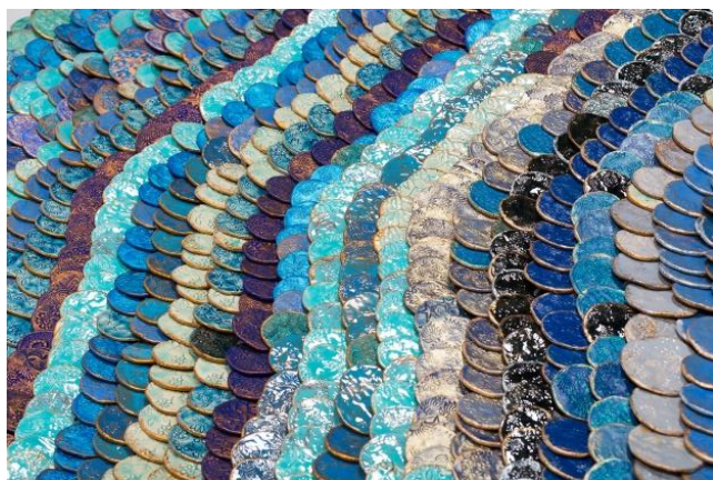
Blue Moon (détails)

« Mon travail est un désir qui projette depuis toujours dans la nature une vision du monde mêlant sacré et profane, réalité et imaginaire... La nature est pleine de métaphores et de métamorphoses, les rêves et le végétal tissent mon inspiration. »