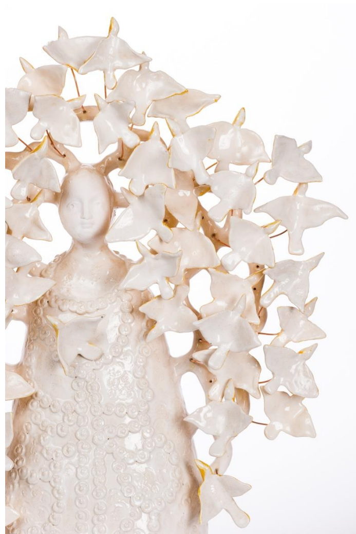
Fabienne AUZOLLE, Arbre de vie , faïence émaillée, 51 x 40 x 11 cm, 2015

complées de parures sous la forme d'innombrables petits modelages de terre colorée, fleurs, oiseaux, nuages, visages qui se déploient en bouquet autour de sa silhouette comme un foisonnement de joie. Un hymne à la création. Le thème renvoie autant à ces peintures rhénanes de « La Vierge au buisson de roses » qu'aux multicolores et fourmillants arbres de vie mexicains.