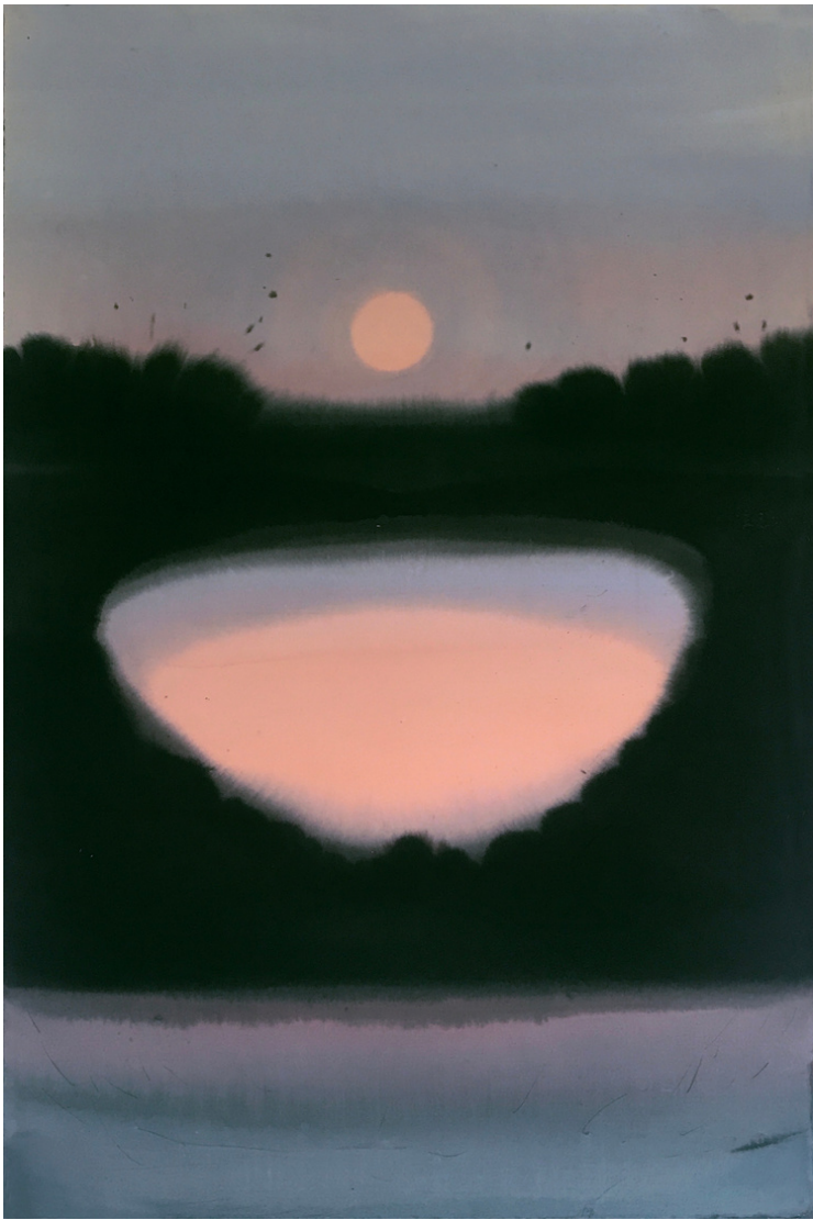
Baigner dans le rose , 120 x 80 cm, encre sur papier, 2022