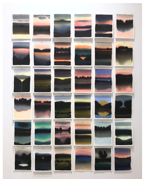
accrochage petits formats 19 x 14 cm, encre sur papier, 2022