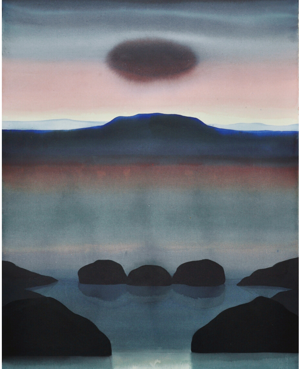
Rochers noirs, 76 x 56 cm, encre sur papier, 2022