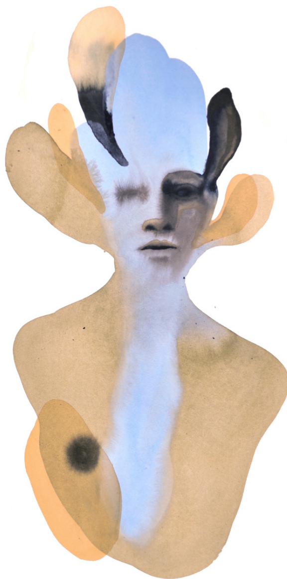
Adolescence , 50 x 35 cm, encre sur papier, 2022