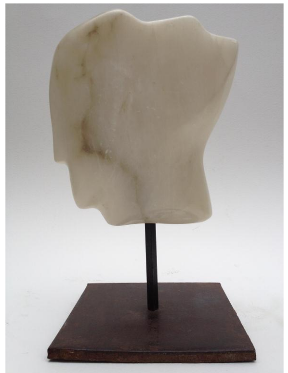
Profil Albâtre 38 x 20 x 20 cm