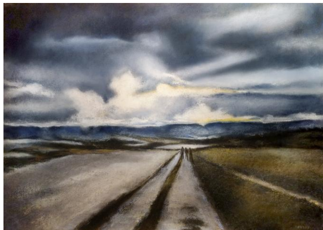
Le Chemin Pastel sec 90 x 122 cm