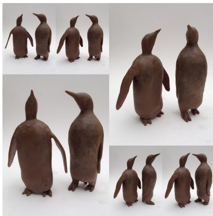
Couples pingouins, bronze, 30 cm

Jérôme Festy est sculpteur et pastelliste. Une évidence pour l'artiste : « Avec le pastel comme en sculpture, j'ai une relation directe à la matière, pas de pinceau, pas d'intermédiaire, c'est la main qui fait corps avec la couleur comme elle le fait avec la pierre, la cire ou la terre ».