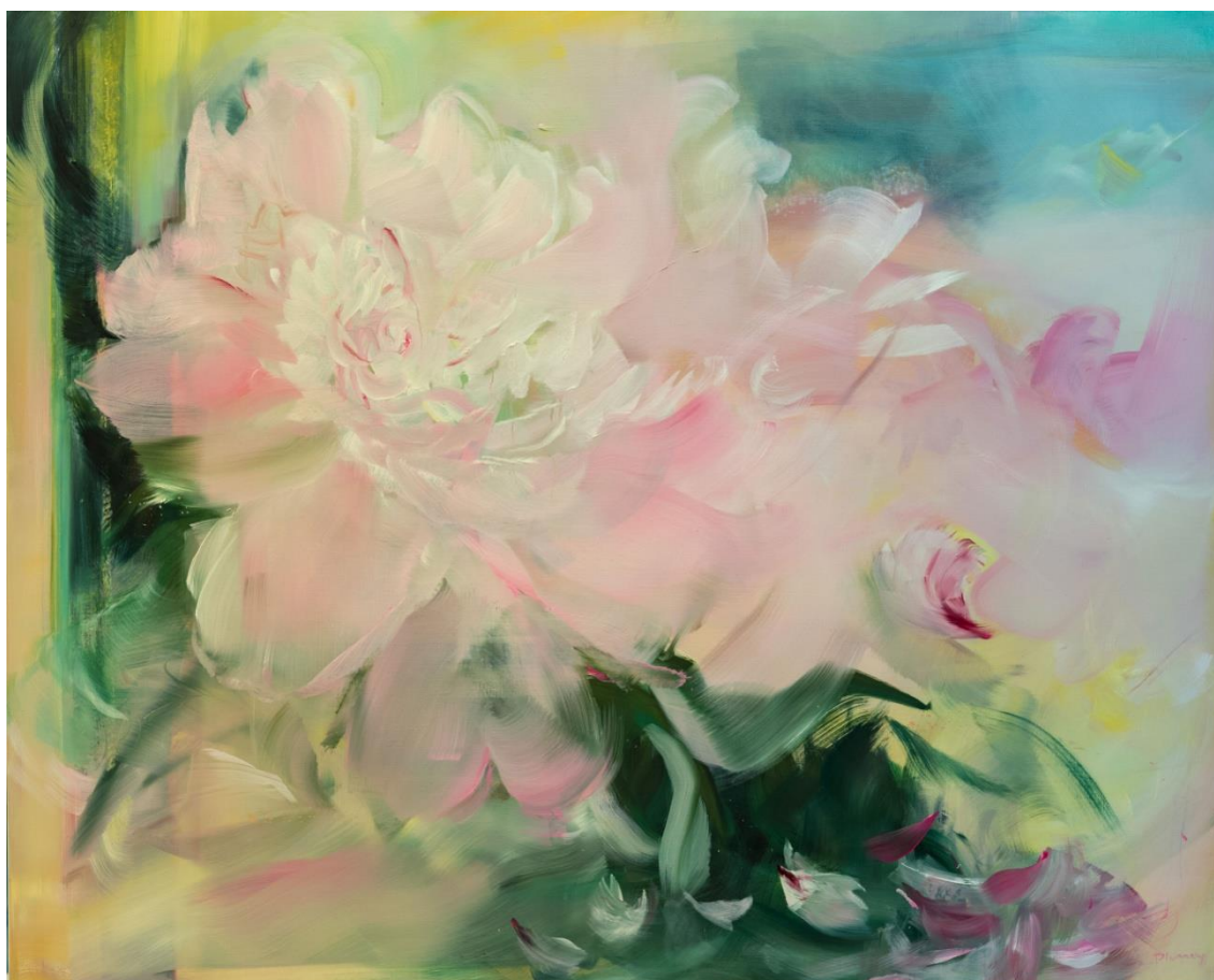
La Force du Fragile , huile sur toile, 97 x 130 cm, 2018

La palette est sensible mais bruisse d'accords puissants et singuliers. La force du fragile, paradoxe essentiel de la peinture de Bénédicte Plumey.