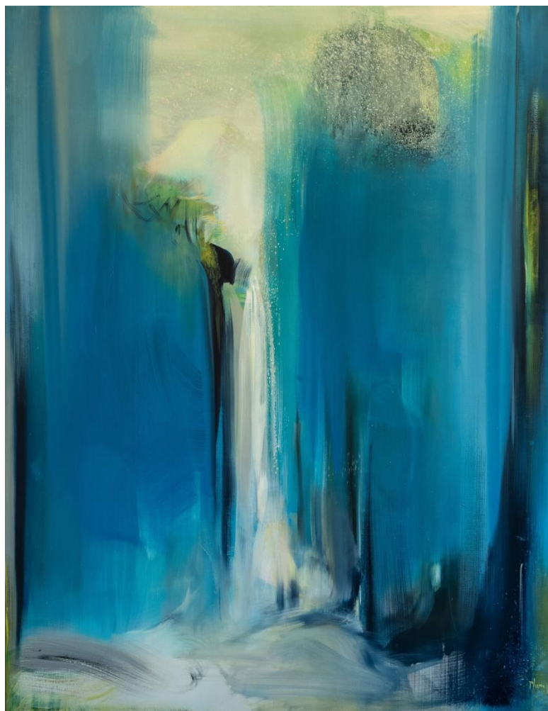
Grande Source bleue, huile sur toile, 146 x 116 cm, 2018