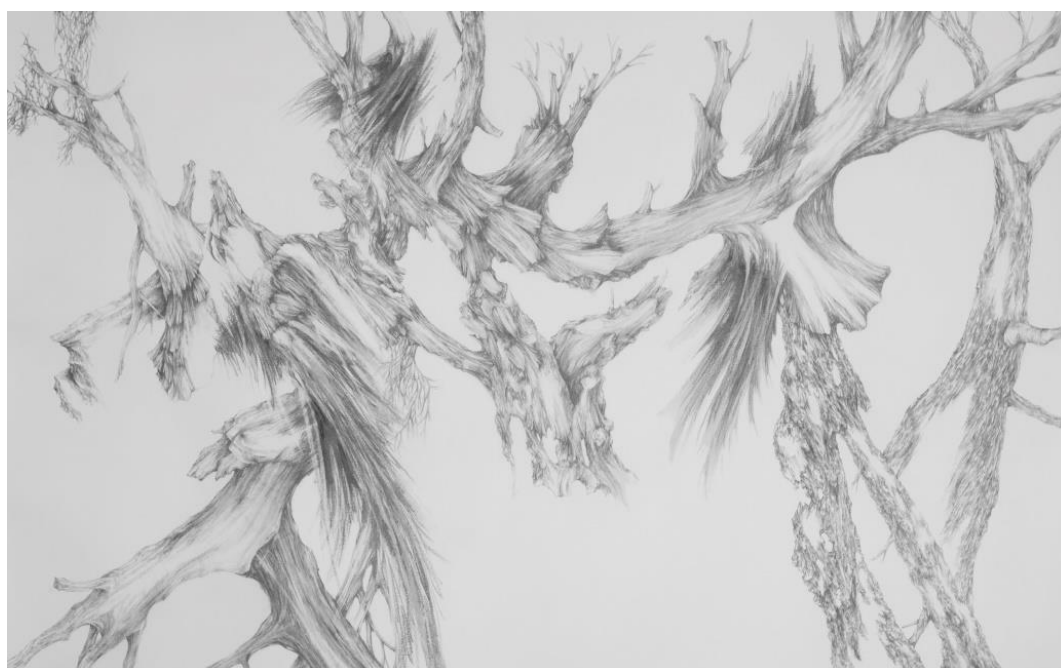
Tempête , Crayon et mine de plomb sur papier, 73 x 117 cm, 2015