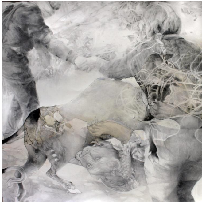
L'enjambée , collage et graphite sur papier, 100 x 100 cm, 2018