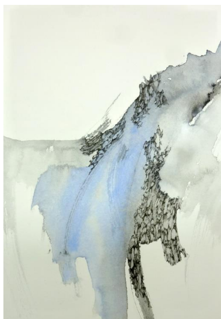
Cascade , Nihonga et technique mixte sur papier, 15 x 20 cm, 2018

Sa réappropriation du procédé traditionnel japonais du nihon-ga * vient approfondir la dynamique de ce voyage exploratoire où la subtilité et la profondeur diffuse des pigments colorés entrent en tension avec la finesse du trait de la mine de plomb ou de l'encre de chine.