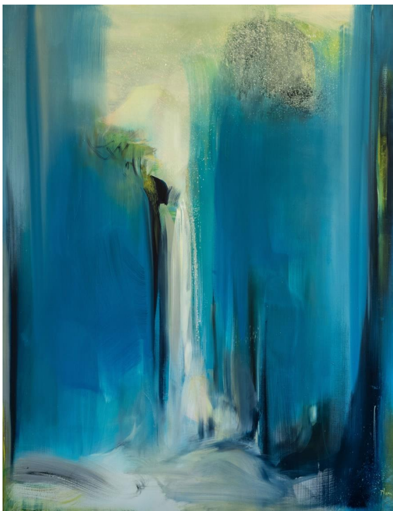
Grande Source bleue, huile sur toile, 146 x 116 cm, 2018

Sensualité des transparences soyeuses, fluidité de l'eau jaillissante, évanescence et délicatesse des blancs colorés affleurant la profondeur des noirs. Dialogue avec l'espace et la lumière, la peinture de Bénédicte Plumey est un subtil travail « abstraitif ». Telle une alchimiste, elle extrait la quintessence de la couleur et de la forme que lui offre la nature, plongeant au cœur du motif initial pour mieux s'en affranchir. Abstraire le réel pour toucher la substance du vivant.